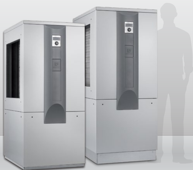
Vzduch/voda pro vnitřní instalaci