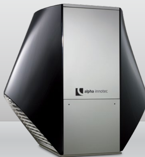
Vzduch/voda pro venkovní instalaci